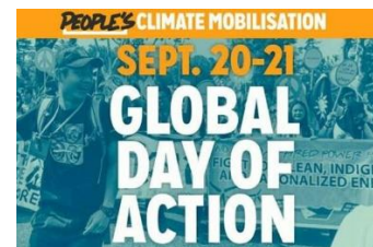
Cartazes da Caminhada pelo Clima – 21/Set/2014