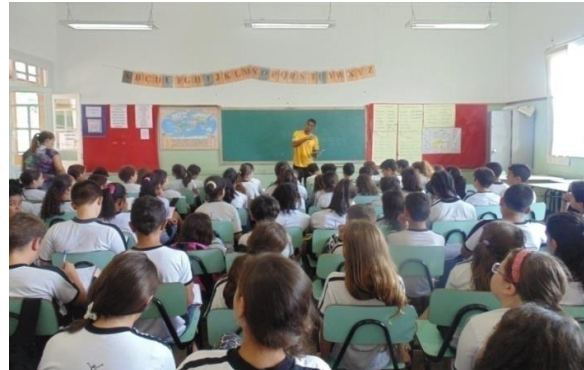
Cooperado da Ação Reciclar falando sobre Coleta Seletiva para alunos do Colégio Municipal