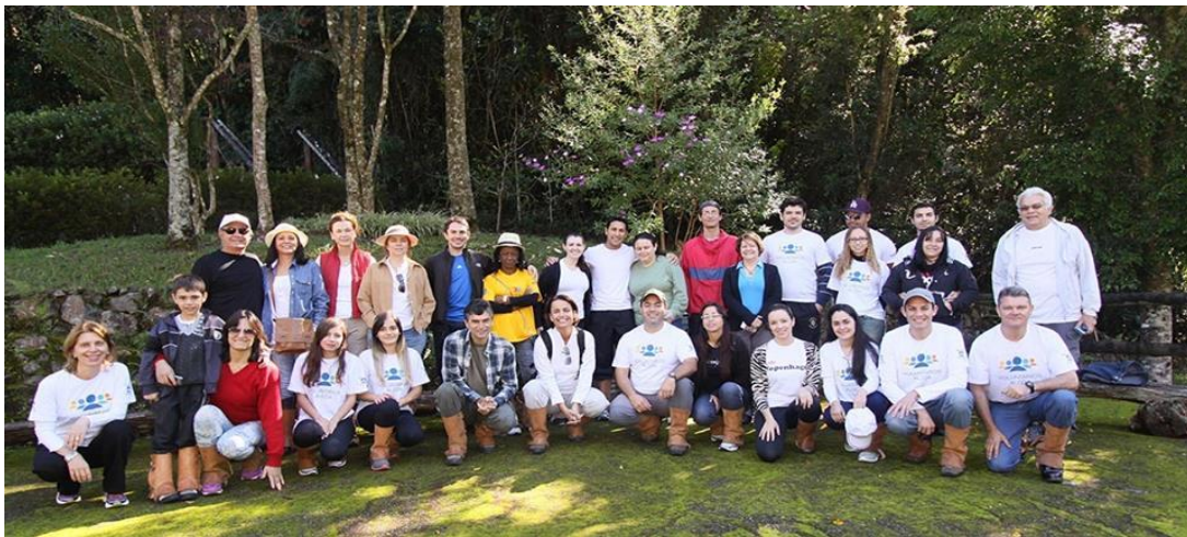
Alcoanos e voluntários da APS que participaram da Caminhada Ecológica pela Trilha do Cedro no Parque Ambiental da Alcoa, no dia 27/Abril/2014