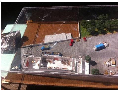
Maquete da Cooperativa Ação Reciclar que foi levada às escolas para conhecimento dos alunos