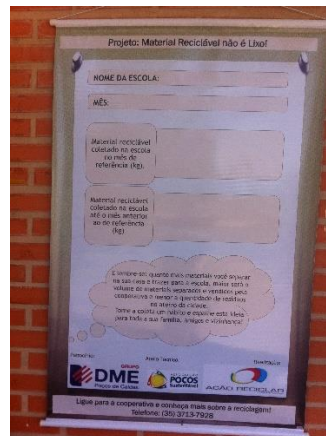
Banner do Projeto deixado nas escolas para controle da Coleta Seletiva