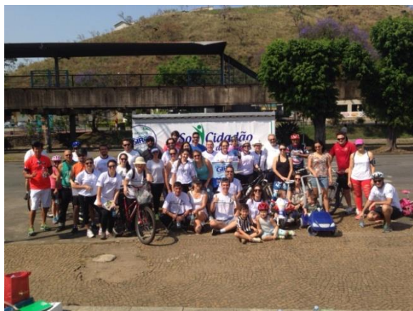
27/Set – Giro na Bike e Caminhada pela Água