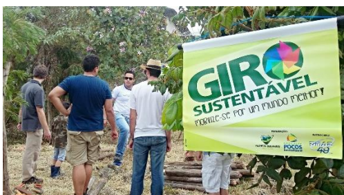
26/Set – Preparação do Jardim de Bolso do Giro Sustentável 2015