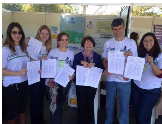
Equipe da APS na Feira Verde