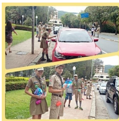
26/Set – Blitz Educativa – Conscientização sobre a Coleta de Óleo e Gordura Usados