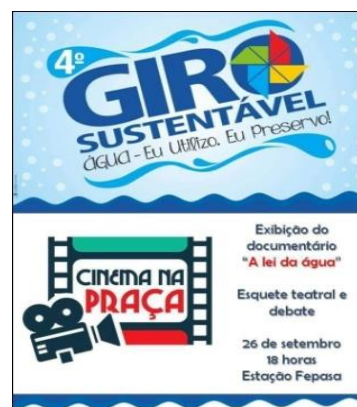
26/Set – Cinema Giro Sustentável – “A Lei da Água”