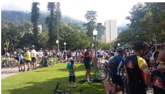
Reunião dos Ciclistas na Praça Pedro Sanches