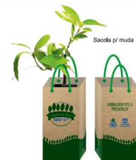
Muda de Árvore