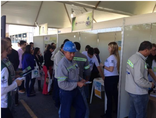
Público da Feira Verde