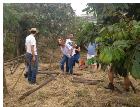
26/Set – Preparação do Jardim de Bolso do Giro Sustentável 2015