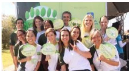
Equipe Coordenadora do ACTION