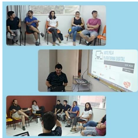
26/Set – Workshop – “Água mole em pedra dura... – Controle Social & Construção de Políticas Públicas