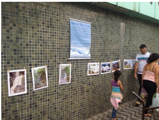
26/Set – Exposição de Banners – Estação Ferroviária