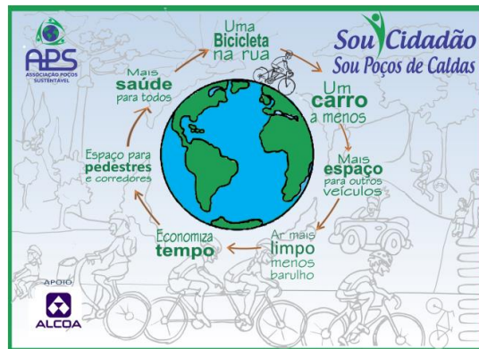
Lado B do panfleto