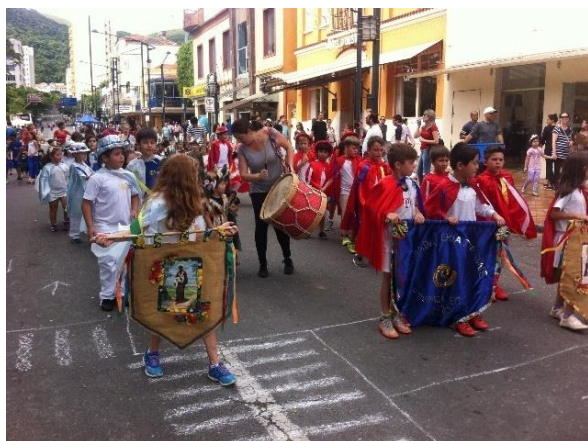
A Escola Criatividade fazendo apresentação na rua em frente à Praça Pedro Sanches, interditada para o trânsito de veículos.