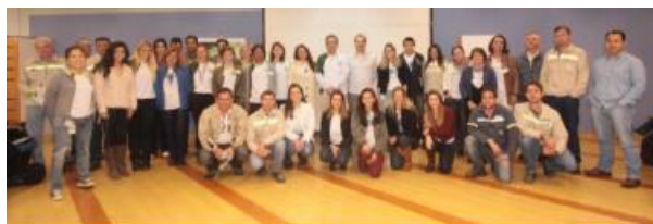
Participantes da Mesa Redonda