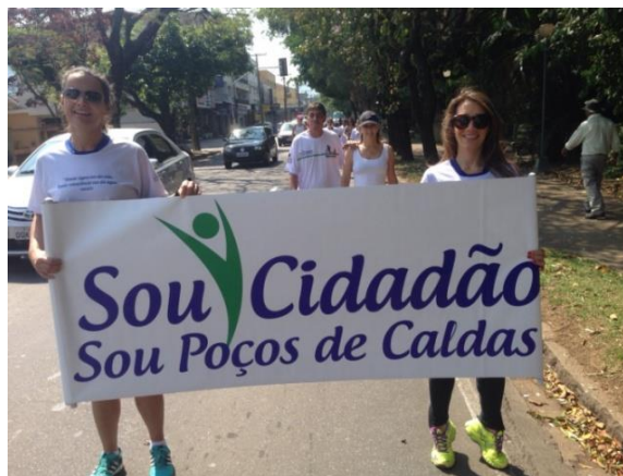
27/Set – Caminhada pela Água