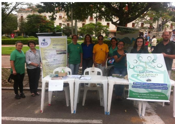
Representantes da APS, Planeta Solidário, Cooperativa Ação Reciclar, Coopergore e Instituto Jardim Botânico de Poços de Caldas.

centro foram fechadas para o trânsito para que as pessoas pudessem usufruir de atividades apresentadas por grupos representativos da cultura de Poços de Caldas e escolas locais.