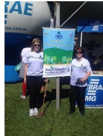
Campanha Sou Cidadão Sou Poços de Caldas no Dia Municipal do Comércio Justo