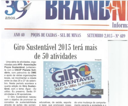
Jornal Brand News