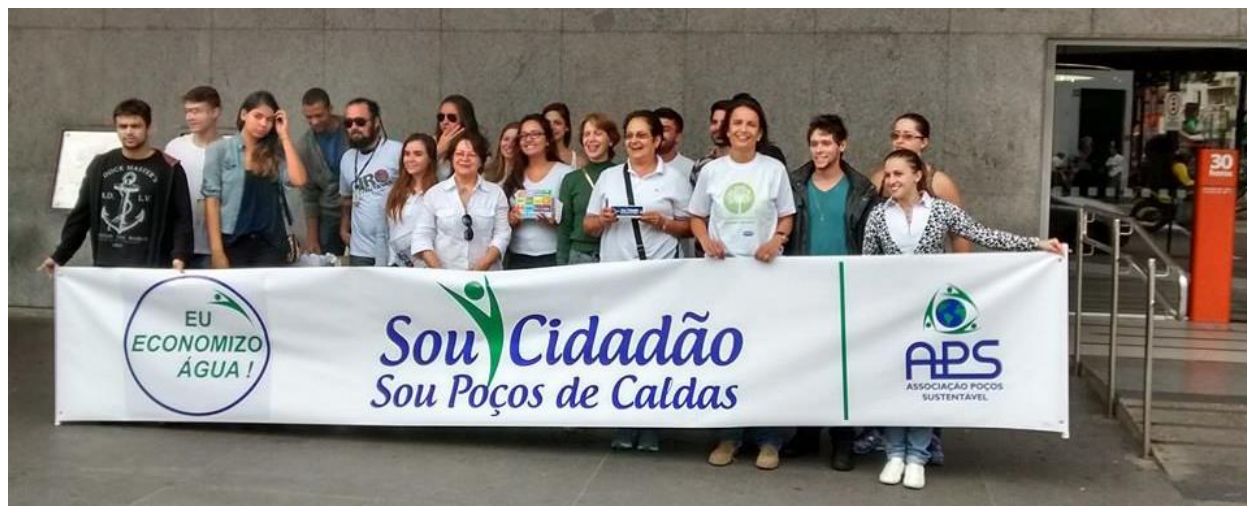
Voluntários que participaram da Blitz Educativa, incluindo funcionários da Alcoa e associados da APS

O lançamento da Campanha foi realizado no dia 21 de março , das 9h00 às 12h00, na esquina das ruas Assis Figueiredo com Prefeito Chagas, com o slogan: “EU ECONOMIZO ÁGUA! Sou Cidadão. Sou Poços de Caldas!”