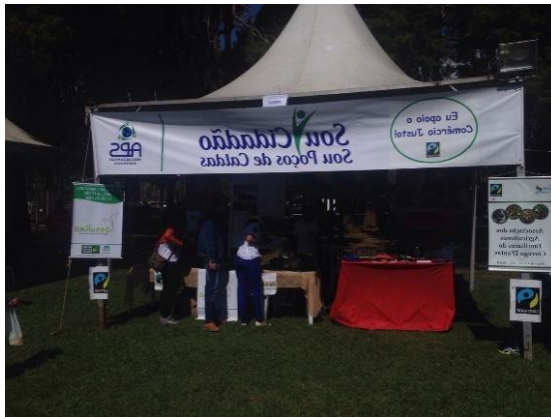
Participação da APS no Dia Municipal do Comércio Justo

30 de outubro é um dia especial para Poços de Caldas, pois comemora a certificação Fair Trade de Poços de Caldas – Primeira cidade do Brasil certificada como Cidade de Comércio Justo.