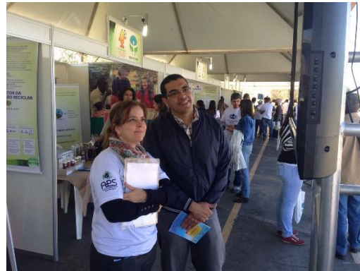
Público da Feira Verde

Foi evidenciado o aumento no número de acessos à plataforma www.economizeoplaneta.com.br no mês de agosto, provavelmente devido à realização da Feira Verde, de 3.103 em julho para 5.345 em agosto.