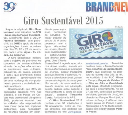
Jornal Brand News