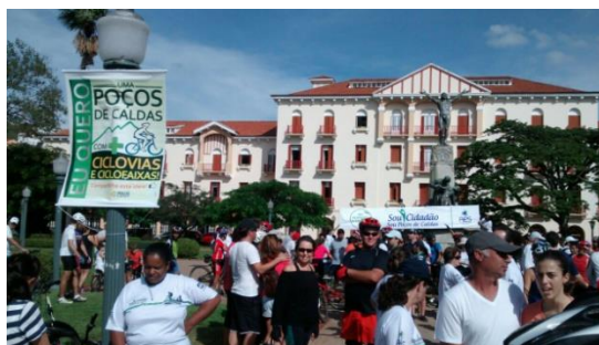
Reunião dos Ciclistas na Parcha Pedro Sanches