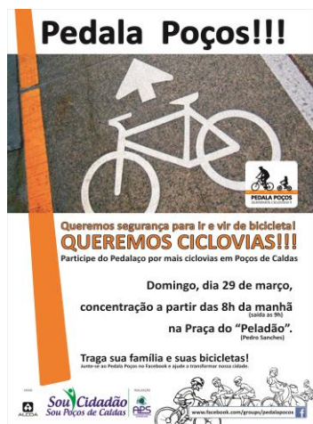
Cartaz para divulgação do evento