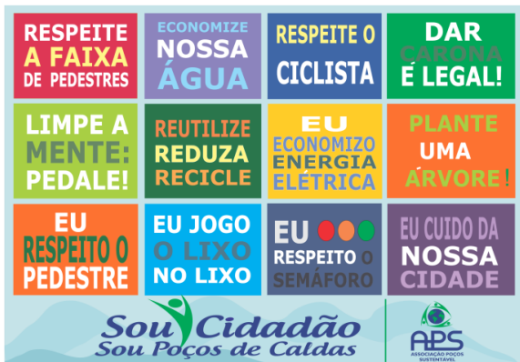
Lado A do Panfleto distribuido no dia do evento.