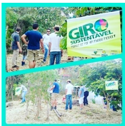
26/Set – Preparação do Jardim de Bolso do Giro Sustentável 2015