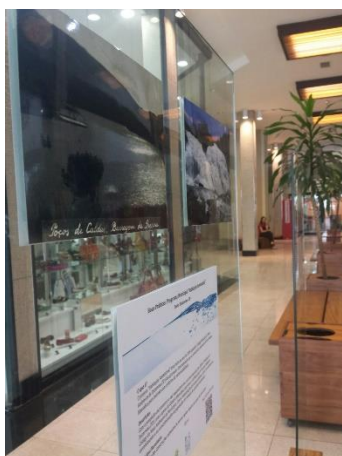
26/Set – Espaço das Águas – Paço das Águas